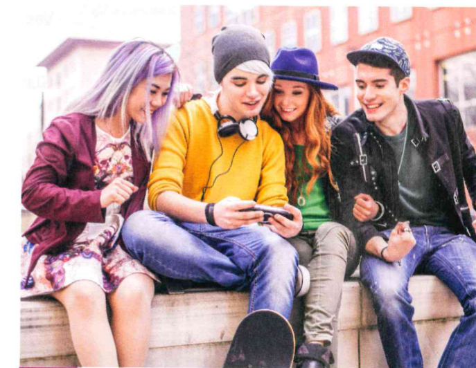
Doc. 4 Un groupe d'adolescents