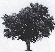
Pommier 3 18,35 kg