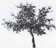
Pommier 1 25,3 kg

* 15 Jérôme a cueilli des pommes sur 4 pommiers. Il a récolté les masses suivantes.