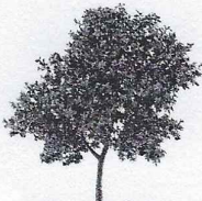
Pommier 4 46,9 kg

Il veut répartir sa récolte dans 4 caisses pour qu'il y ait la même masse de pommes dans chacune.