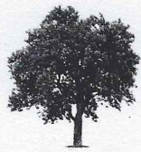
Pommier 2 34,65 kg